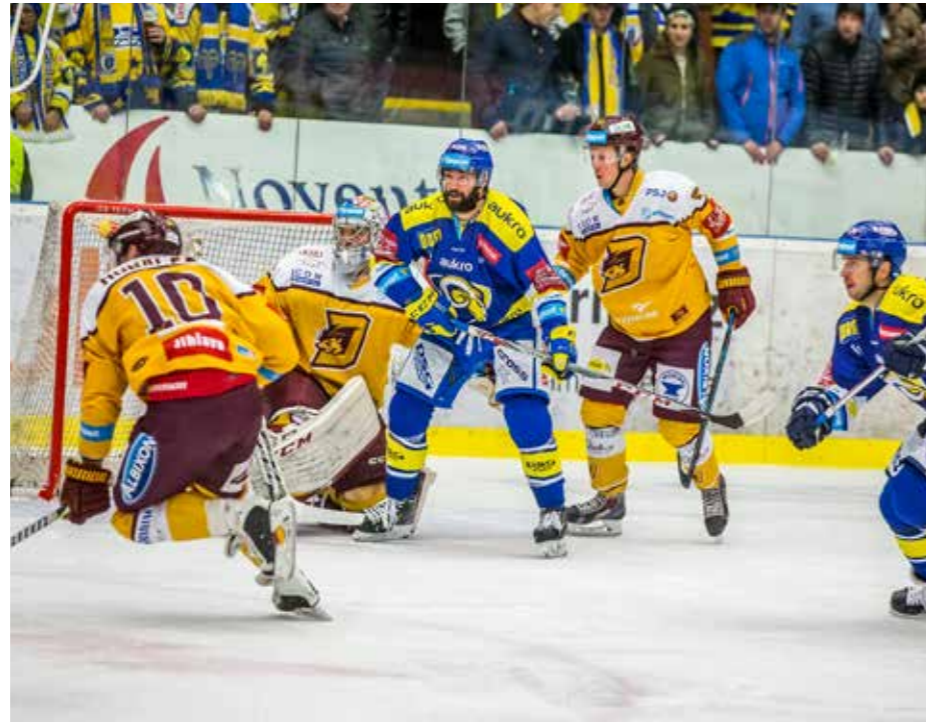
DVĚ ZBRANĚ přesilovková střela a pohyb v předbrankovém prostoru