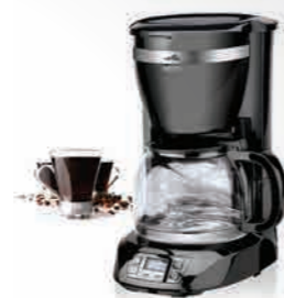
Kávovar ETA Inesto, digitální

Zaregistrujte se v nejbližší prodejně ENAPO.