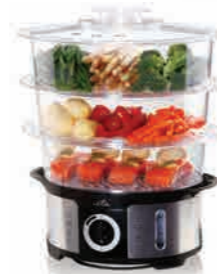
Parní hrnec ETA Steampot