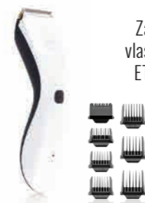
Zastříhovač vlasů a vousů ETA Tommy, bílý